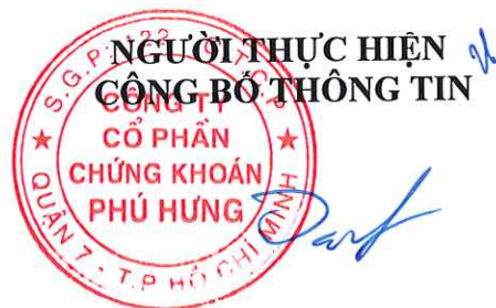
Ông CHEN CHIA KEN