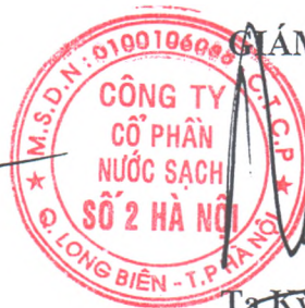
Tạ Kỳ Hưng