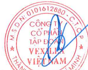
Tổng Giám đốc