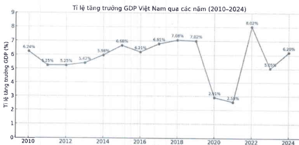
Hình 1: Tỷ lệ tăng trưởng GDP Việt Nam qua các năm

Là một doanh nghiệp hoạt động chủ yếu tại thị trường Việt Nam, Công ty luôn theo dõi sát sao biến động thị trường chung để đưa ra quyết sách, chiến lược kinh doanh hợp lý. Mặc dù nền kinh tế Việt Nam vẫn đạt mức tăng trưởng ổn định trong năm 2024, và được dự báo sẽ