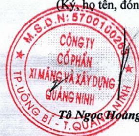
Tô Ngọc Hoàng

Ghi chú: Những chỉ tiêu hoặc nội dung đơn vị không có số liệu hoặc thông tin thì không phải trình bày và không được đánh lại số thứ tự chỉ tiêu và “Mã số”.