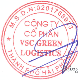
Đông Trung Hải