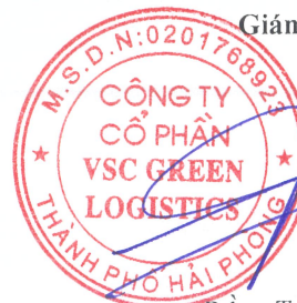
Đông Trung Hải