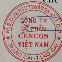
TRẦN MẠNH SƠN