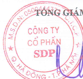
PHẠM TRƯỜNG TAM