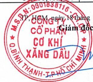
Đoàn Đắc Học