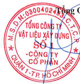
Cao Trường Thụ