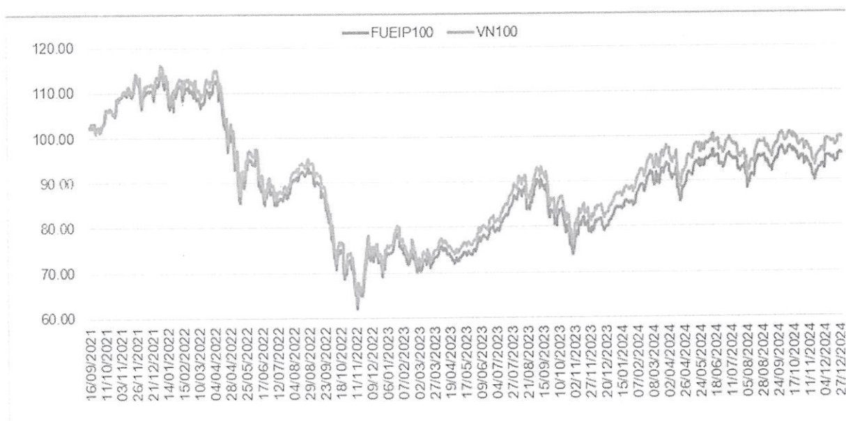
Biểu đồ tăng trưởng của FUEIP100 và bám sát chỉ số VN100

Quỹ ETF IPAAM VN100 thực hiện theo đúng mục tiêu đầu tư của quỹ là bám sát mức sinh lời thực tế của chỉ số VN100 trong tất cả các giai đoạn, tại 31/12/2024 Quỹ có mức sai lệch so với chỉ số tham chiếu ở mức thấp, trong mức quy định, khoảng 0,5%.