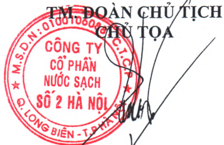
Dương Quốc Tuấn