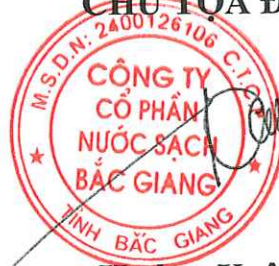
Hương Xuân Công