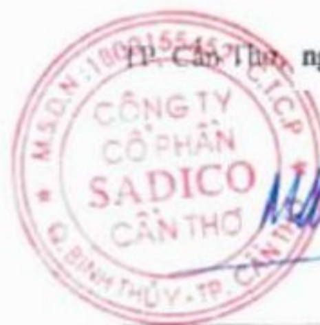
Mai Công Toàn Chủ tịch Hội đồng quản trị