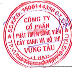
Chủ tịch Hội đồng quản trị Lê Huy Hữu Hiệp Tỉnh Bà Rịa - Vũng Tàu Ngày 17 tháng 03 năm 2025