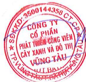
Chủ tịch Hội đồng quản trị Lê Huy Hữu Hiệp Tỉnh Bà Rịa - Vũng Tàu Ngày 17 tháng 03 năm 2025