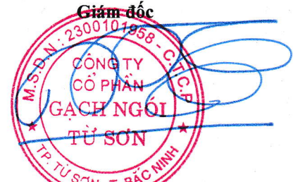
Trần Xuân Hùng