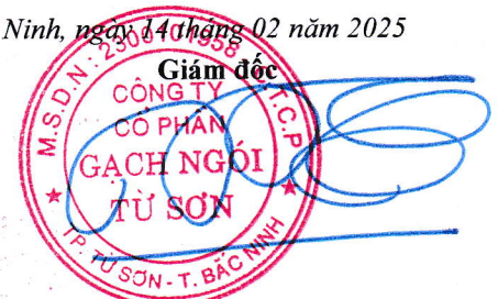
Trần Xuân Hùng