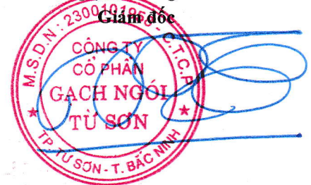
Trần Xuân Hùng