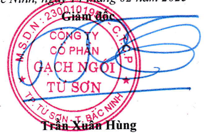
Trần Xuân Hùng