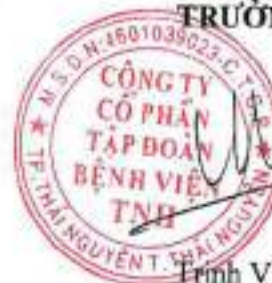
Trịnh Việt Trang