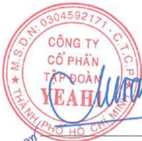
Chế Đoàn Viên Phó Tổng Giám đốc

Theo đây, tôi phê chuẩn báo cáo tài chính riêng giữa niên độ đính kèm từ trang 3 đến trang 47. Báo cáo tài chính riêng giữa niên độ này phản ánh trung thực và hợp lý tình hình tài chính riêng của Tập đoàn tại ngày 30 tháng 09 năm 2024 cũng như kết quả hoạt động kinh doanh riêng và tình hình lưu chuyển tiền tệ riêng cho kỳ kế toán kết thúc cùng ngày nêu trên, phù hợp với các Chuẩn mực Kế toán Việt Nam, Chế độ Kế toán Doanh nghiệp Việt Nam và các quy định pháp lý có liên quan đến việc lập và trình bày báo cáo tài chính riêng giữa niên độ.