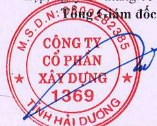
Trần Xuân Bản