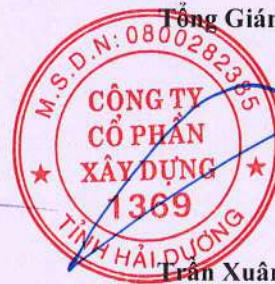
Trần Xuân Bản