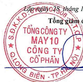
Thân Đức Việt