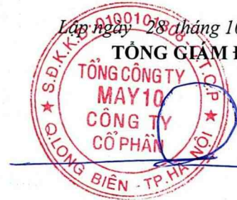
Thân Đức Việt