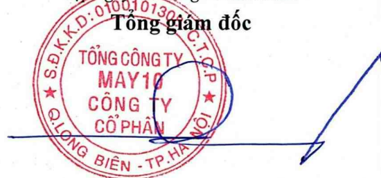
Thân Đức Việt