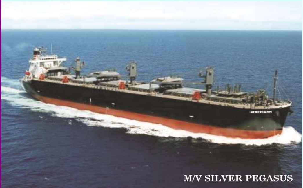
M/V SILVER PEGASUS