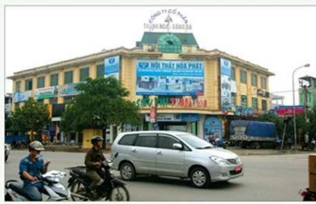
Trung tâm thương mại 301 Trần Phú