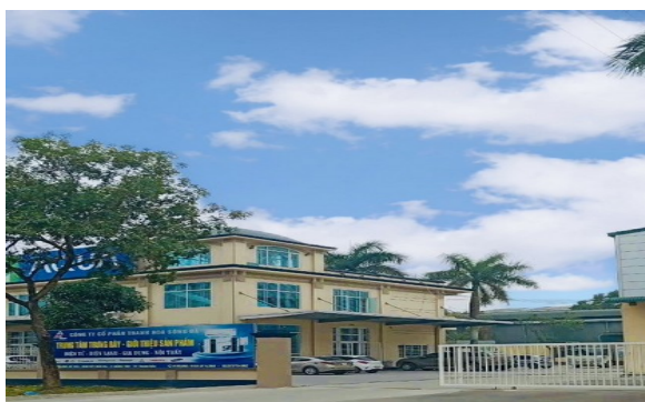
Văn phòng và kho hàng tại KCN Tây Bắc Ga

Địa điểm kinh doanh: Công ty có showroom bán hàng và các kho chứa hàng tại KCN Tây Bắc Ga, Đình Hương, Phường Đông Thọ, Thành phố Thanh Hóa