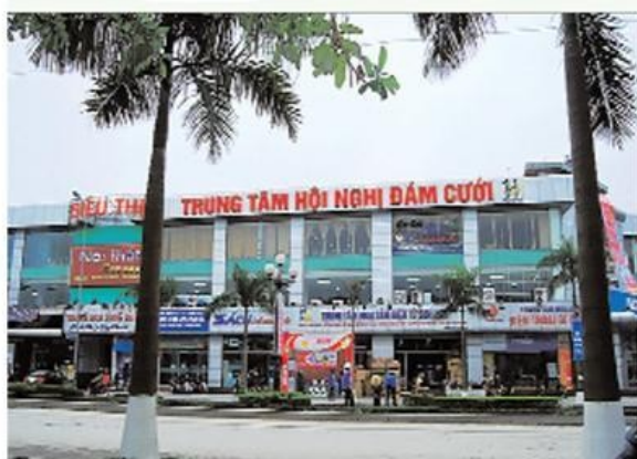
Trung tâm thương mại 25 Đại lộ Lê Lợi