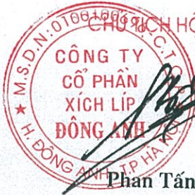
Phan Tấn Bình

III - Cuộc họp kết thúc : vào 9h45 cùng ngày và được 100% các thành viên tham dự thông qua.