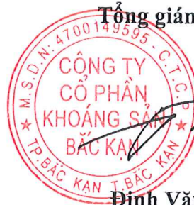
Đình Văn Hiến